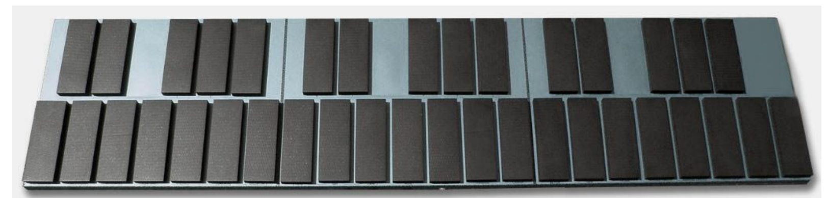
LibreVibes - Imagen ilustrativa